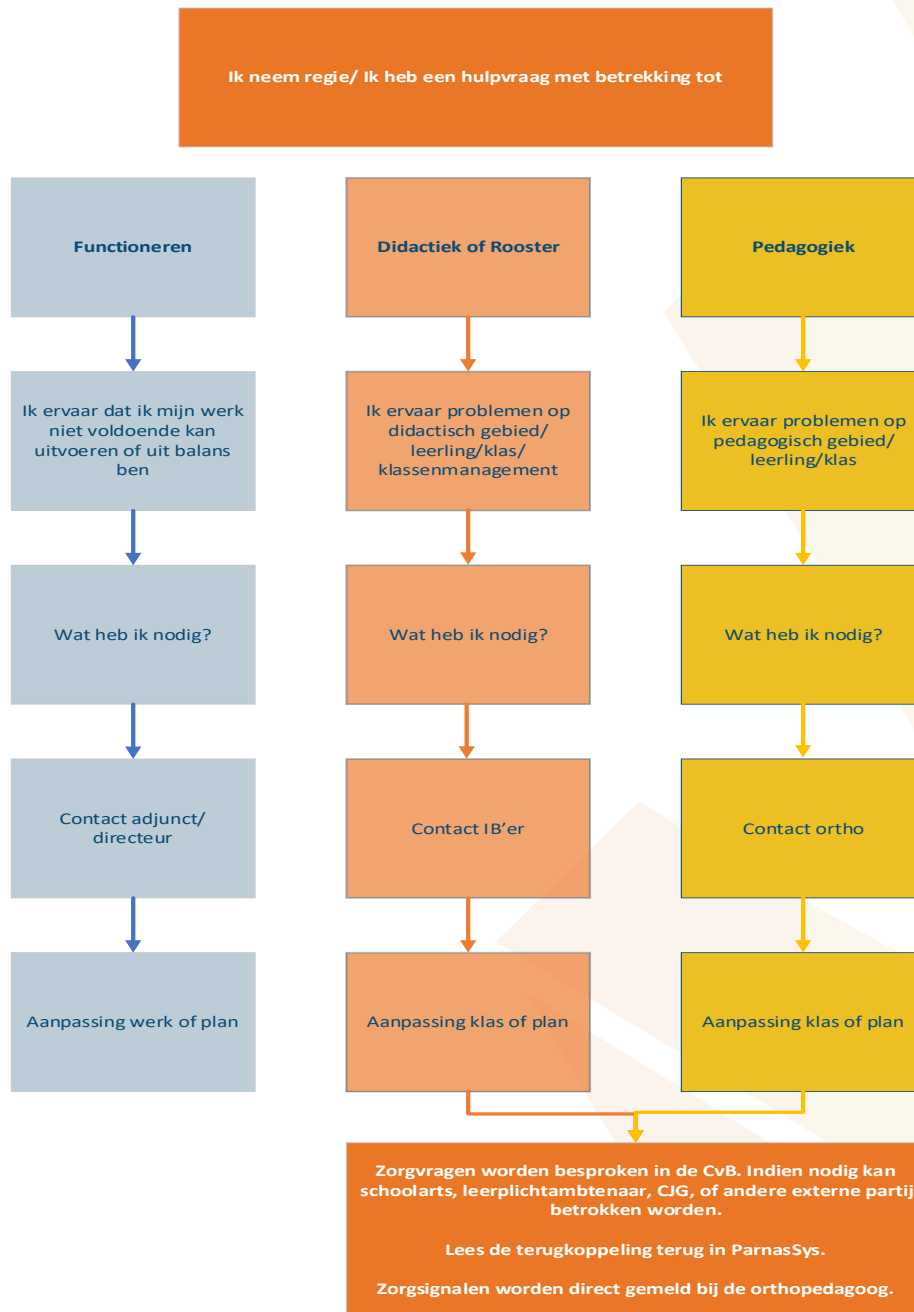
Figuur 2 Zorgroute VSO Heuvelrug College